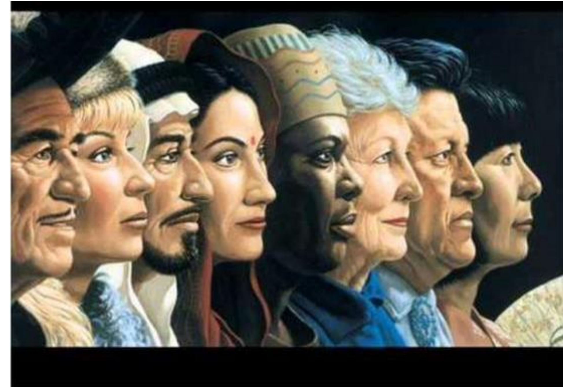
El turismo puede provocar, una desculturización del destino.